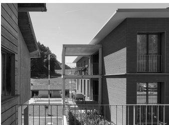
Karolinenheim Rumendingen Behindertenheim ID | 10.11 ART | Neubau, Erweiterung AUFTRAGSART | Studienauftrag 1. Preis KATEGORIE | Wohnen, Öffentliche Bauten BAUHERR | Stiftung Karolinenheim ORT | Rumendingen, BE BAUSUMME | 10,0 Mio JAHR | 2013 - 2015