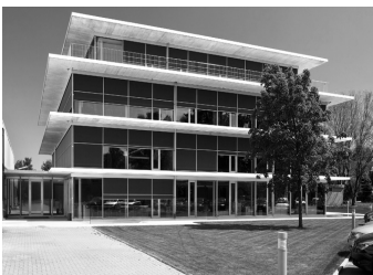
Ronal AG Härkingen Verwaltung | Produktion ID | 07.07 ART | Neubau Hauptsitz AUFTRAGSART | Direktauftrag BAUHERR | Ronal AG, Härkingen KATEGORIE | Dienstleistung & Industrie ORT | Härkingen, SO JAHR | 2008 - 2010