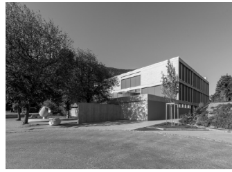
Sanierung Schulhaus Rüttenen ID | 16.09 ART | Sanierung AUFTRAGSART | Direktauftrag BAUHERR | EWG Rüttenen KATEGORIE | Öffentliche Bauten ORT | Rüttenen, SO JAHR | 2017 - 2019