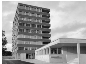
Wohn- und Dienstleistungsgebäude Wyss | Lohn ART | Neubau AUFTRAGSART | Direktauftrag BAUHERR | Privat KATEGORIE | Wohnen & Dienstleistung ORT | Lohn-Ammannsegg, SO JAHR | 2013 - 2019