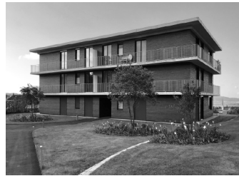
Gummenhubel Grenchen ID | 11.07 ART | Neubau AUFTRAGSART | Direktauftrag BAUHERR | Branger Architekten KATEGORIE | Wohnen ORT | Grenchen, SO JAHR | 2016 - 2018