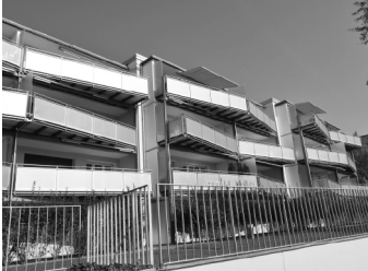
Sanierung MFH Grenchen ID | 15.08 ART | Sanierung & Umbau AUFTRAGSART | Direktauftrag BAUHERR | KATEGORIE | Wohnen ORT | Grenchen, SO JAHR | 2018 - 2019