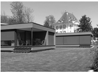
DEFH Solothurn ID | 11.05 ART | Neubau AUFTRAGSART | Direktauftrag BAUHERR | Privat KATEGORIE | Wohnen ORT | Solothurn, SO JAHR | 2013 - 2015