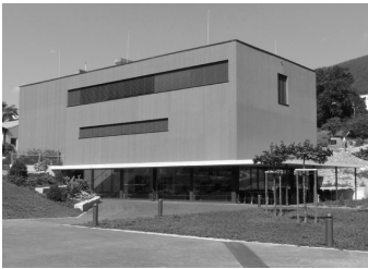
Bachtelen Grenchen Verwaltung | Cafeteria ID | 12.01 ART | Neubau Ökonomiegebäude AUFTRAGSART | Studienauftrag 1. Preis BAUHERR | Bachtelen Sonderpädago. KATEGORIE | Dienstleistung ORT | Grenchen, SO BAUSUMME | 6,2 Mio JAHR | 2013 - 2015