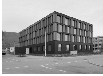
SWG Grenchen Betriebsgebäude | Verwaltung ID | 12.11 ART | Neubau AUFTRAGSART | Studienauftrag 1. Preis BAUHERR | SWG Grenchen KATEGORIE | Dienstleistung, Gewerbe ORT | Grenchen, SO JAHR | 2013 - 2015