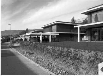
Häslimatt Biberist ID | 17.03 ART | Neubau AUFTRAGSART | Direktauftrag BAUHERR | Privat KATEGORIE | Wohnen ORT | Biberist, SO JAHR | 2019 -