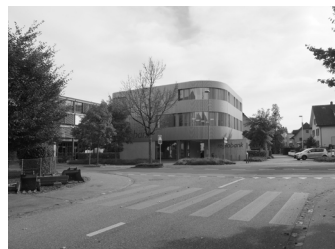
Neubau Regiobank Zuchwil ID | 10.06 ART | Neubau AUFTRAGSART | Studienauftrag 1. Preis BAUHERR | Regiobank Solothurn AG KATEGORIE | Dienstleistung & Wohnen ORT | Zuchwil, SO JAHR | 2015 - 2017