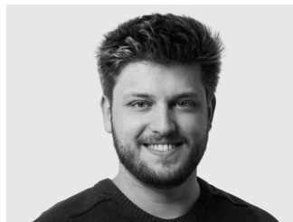
David Süntinger Planung 100% | Architekt BAA BFH-AHB